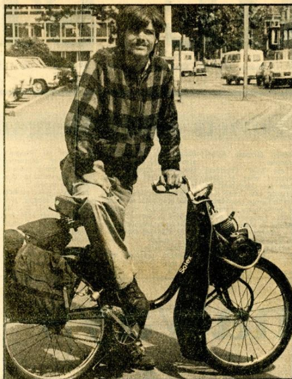
Tim Horton and mount... the slow, cheap route.

Under his arm he held a large sign. It read: "No smoking."